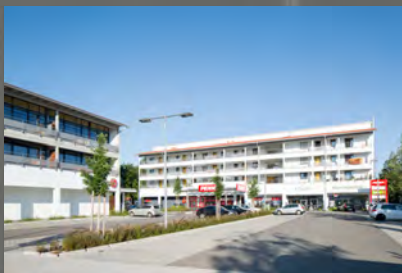
Ansicht mit Balkonen