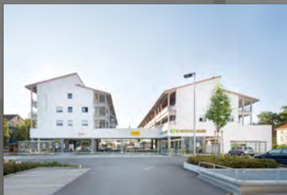
Seitenansicht beider Häuser