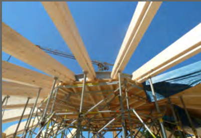
Ansicht Holzrahmenkonstruktion in Bauphase